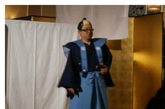
暴れん坊将軍!? 小林会員