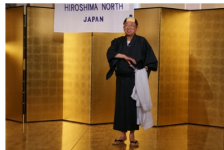
桃太郎侍!? 藤田会員