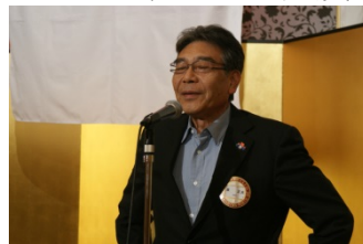
締めは 泉副会長で!