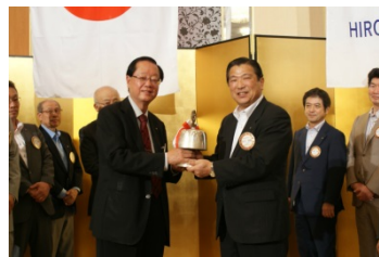
まずは、次年度への点鐘引継式