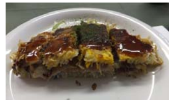
例会の食事はやっぱり“お好み焼き”で