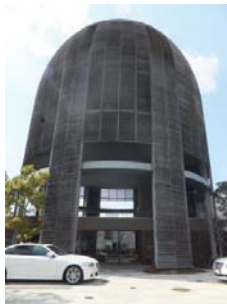
Wood Egg お好み焼館