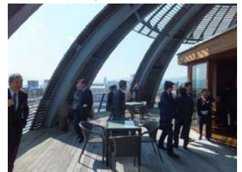
5階の見晴らしは最高です