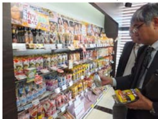
お土産もたくさん購入