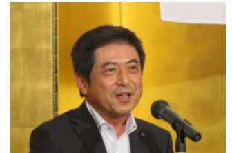
閉会挨拶 三保副会長