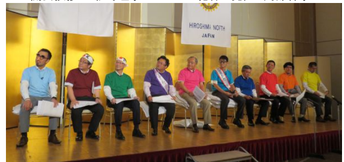
新会員13名による出し物♪