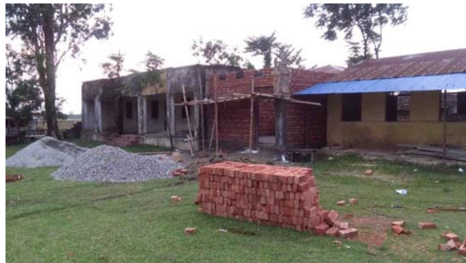
K A 中学校 生徒数:総数649人, 女子生徒346人, 男子生徒303名 12歳以上の女子生徒は295人(45.14%)