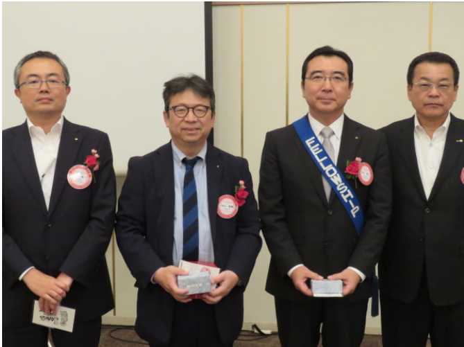
秋山会員・中山会員・池上会員 おめでとうございます！ また還暦を迎えた中山会員には別途記念品が贈られました。