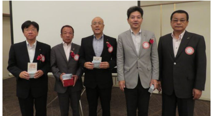
左から、中根会員、桑村会員、杉町会員、浦会員、東会長 おめでとうございます！