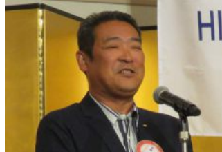
開会挨拶 下前常任委員長