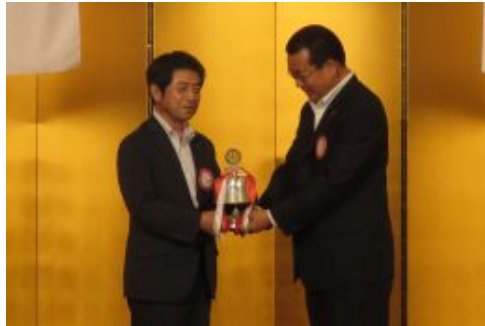
点鐘引継ぎ 東会長から三保次年度会長へ