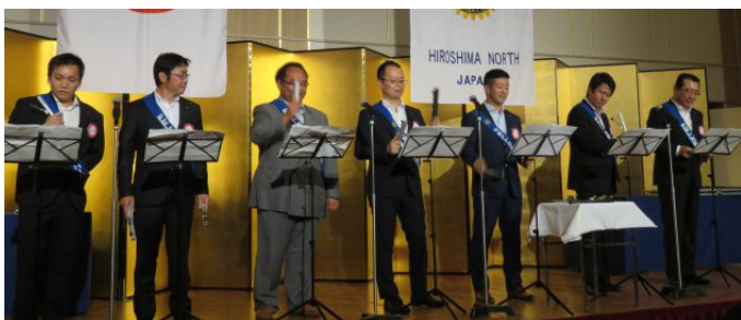
新会員による出し物