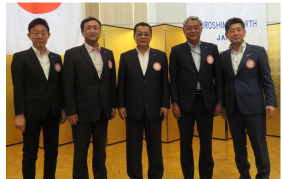
正副会長幹事一年間お疲れ様でした！